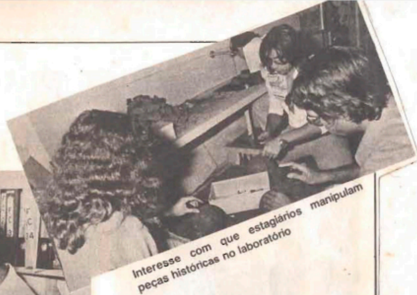
Interesse com que estagiárias manipulam peças históricas no laboratório