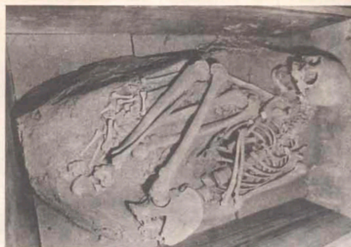
Quando um esqueleto passa a significar perante os vivos: uma projeção arqueológica

JORNAL UNIVERSITÁRIO — RECIFE — JAN - FEV - MAR — 1968